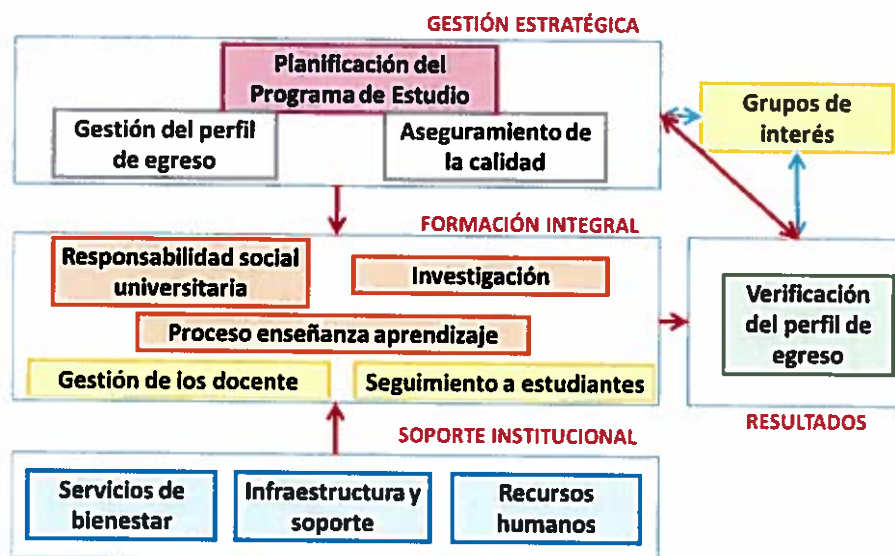
Figura 4: Relación de dimensiones y factores del modelo de acreditación de programas de estudios universitarios

de egreso, identificar procesos que se requieren para desarrollarlo, así como en relación al grado de satisfacción con la formación de los egresados ayudando en la evaluación del desempeño profesional.