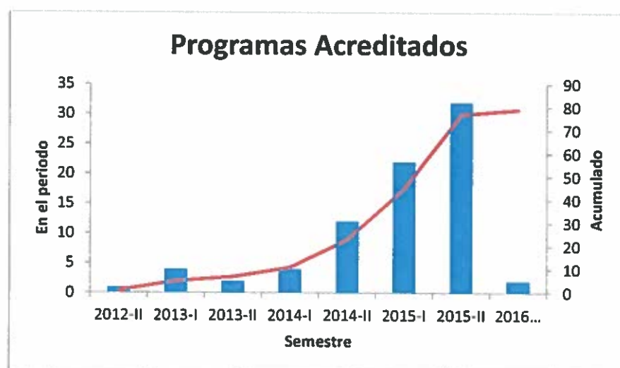
Figura 1 Acreditaciones otorgadas por semestre y acumuladas hasta febrero del 2016